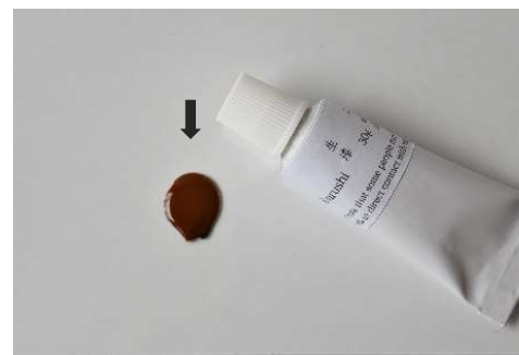
① laque urushi