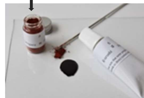
⑤ rouge oxide