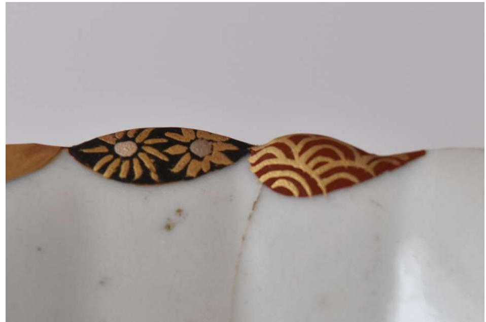
en laque d'or ou d'argent