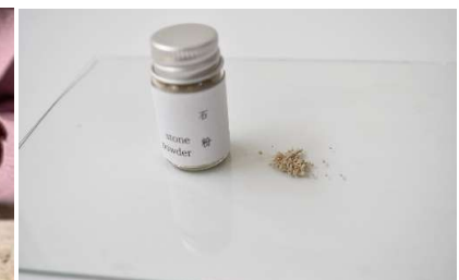
poussière de pierre