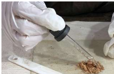
spatule en silicium