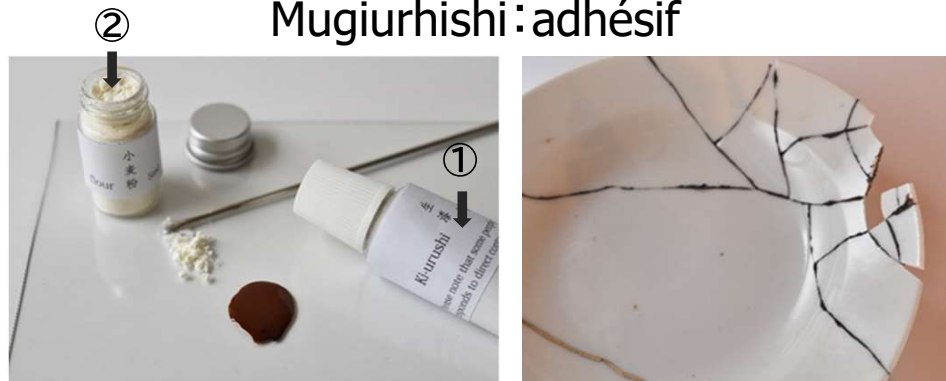
Mugiurhishi : adhésif