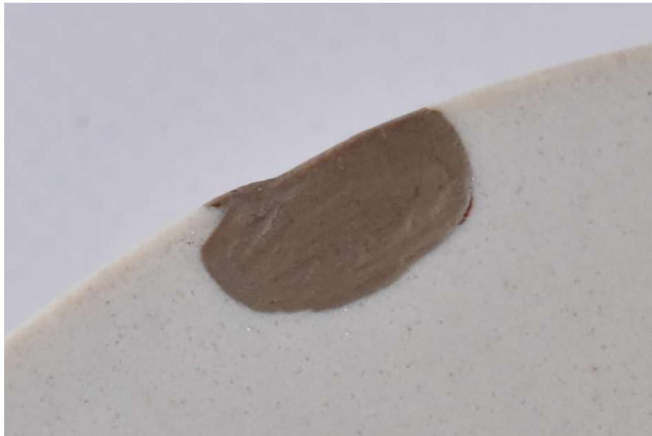
en poudre argent