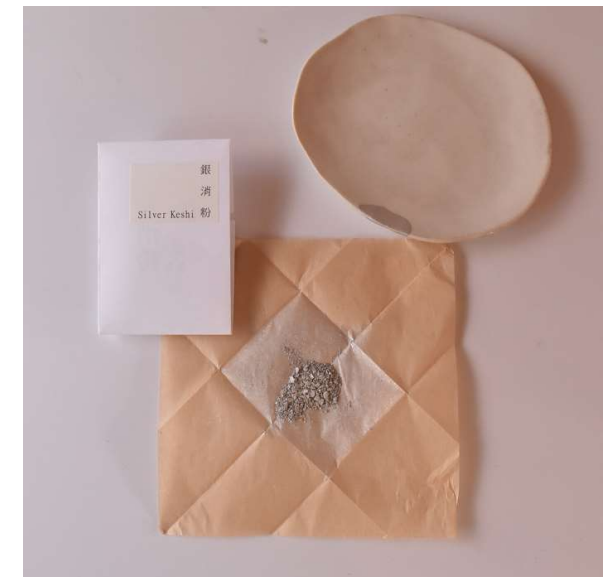
particule fine d'argent