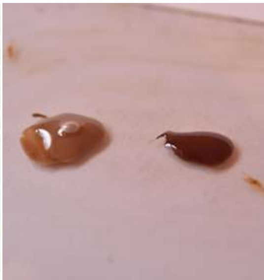
bois et laque d'urushi