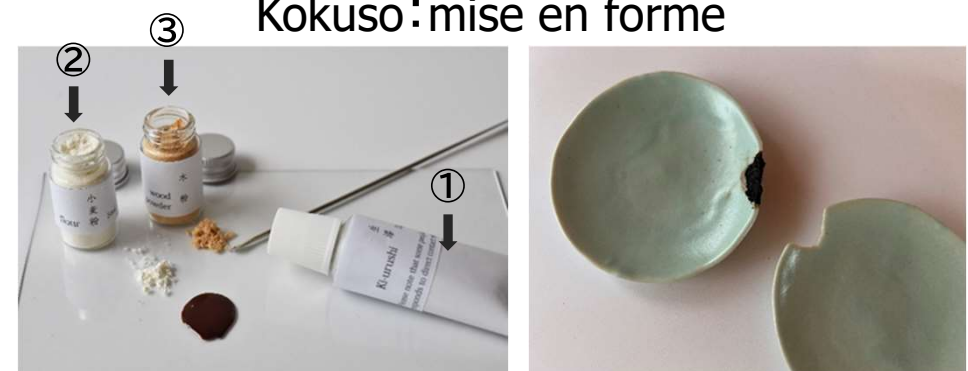
Kokuso : mise en forme