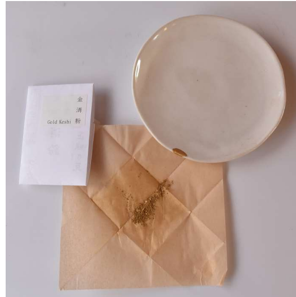
particule fine d'or