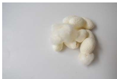
filage du cocon