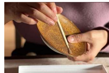
pinceau pour broser