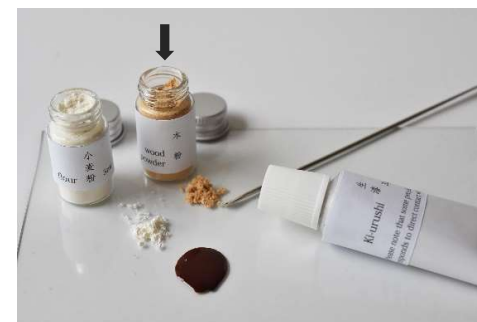
③ farine de bois