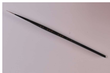
pinceau pour peinture