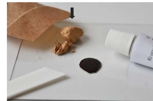
④ sol en poudre