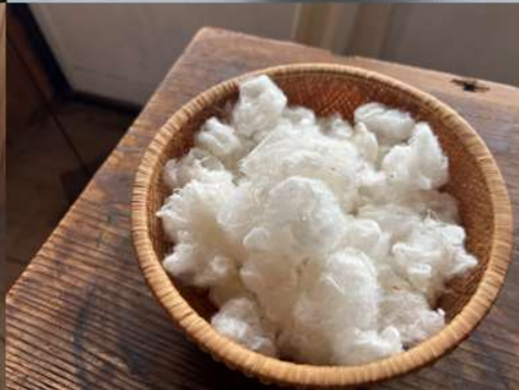
L'art de vivre au naturel et durable