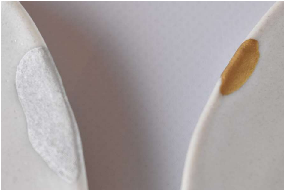
en particule fine (l'or ou l'argent)