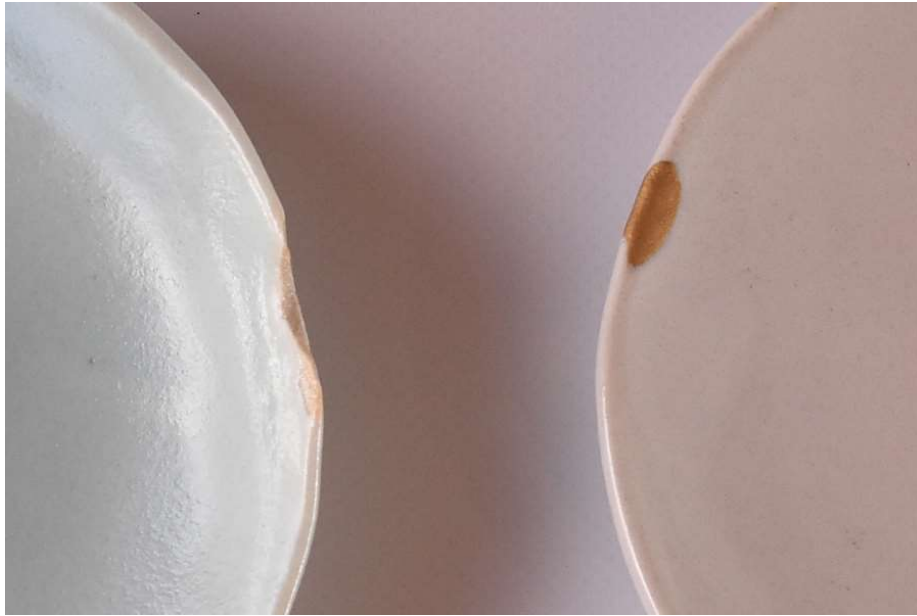
小さな欠けを直す