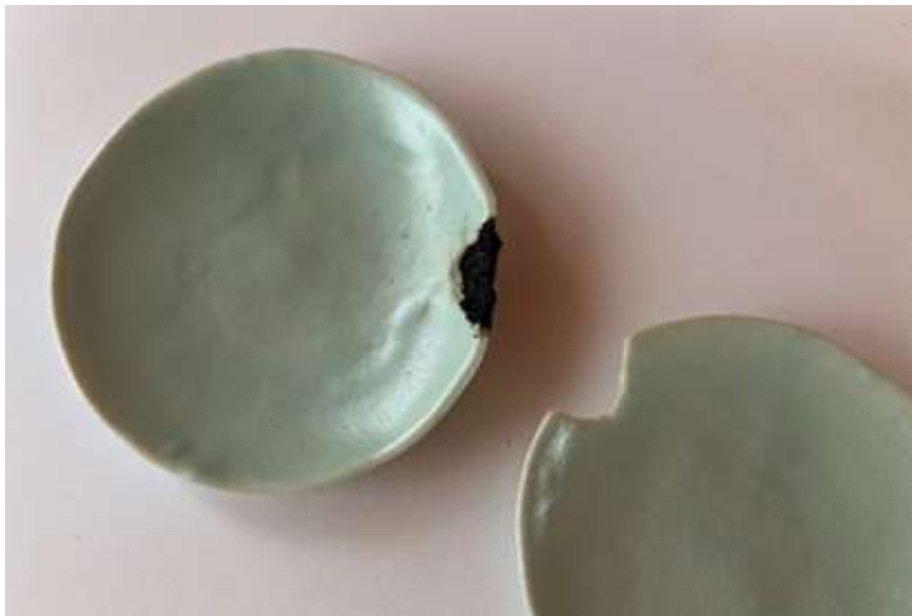
大きな欠けを直す