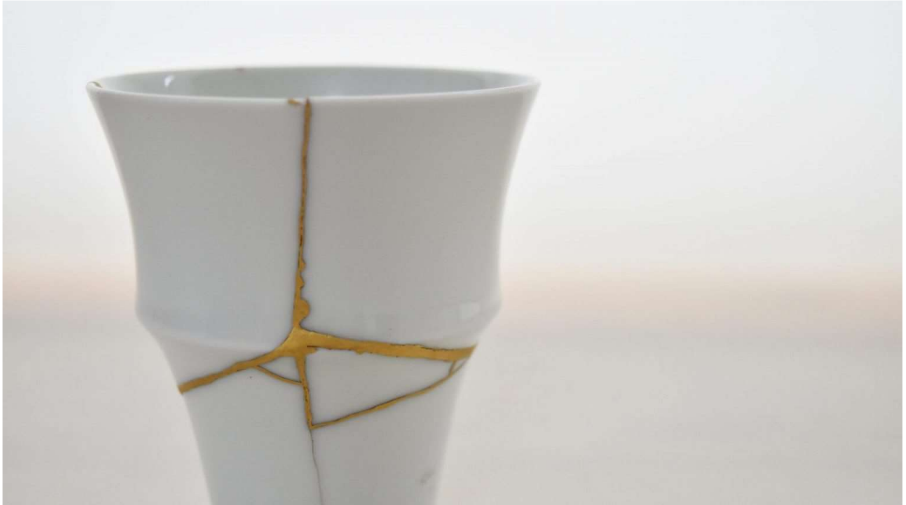
Japanese repair Kintsugi