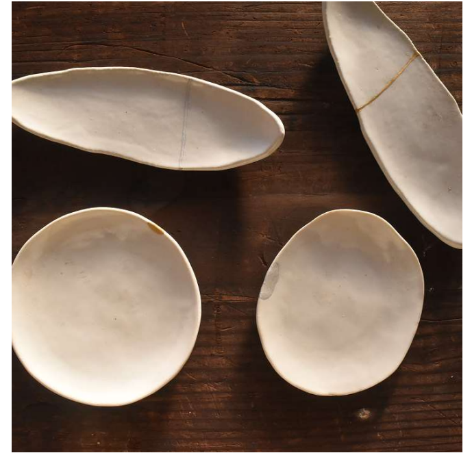
ii. 仕上げに装飾を施す